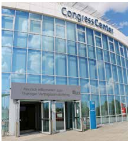
Congress Center der Erfurter Messe

Bei inhaltlichen/organisatorischen Fragen steht Ihnen Frau Kornmaul (0361/67 67 127) zur Verfügung. Die Anmeldung erfolgt über Frau Koch (0361/67 67 105).