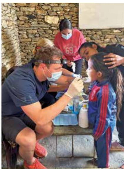
Untersuchung im Klassenzimmer