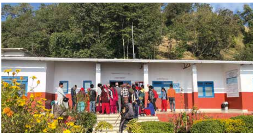
Wartezimmer im Freien: Schlangestehen vor der Zahnarzt-Behandlung