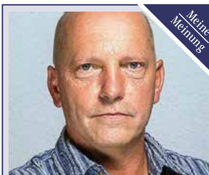
Jens Voigt, Redakteur der Ostthüringer Zeitung