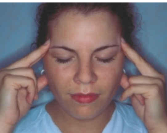
Schläfenansatz Abb. 10